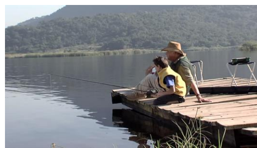
Padre e hijo / Pesca / Laguna