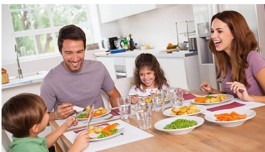
Familia / Desayuno / Chistes